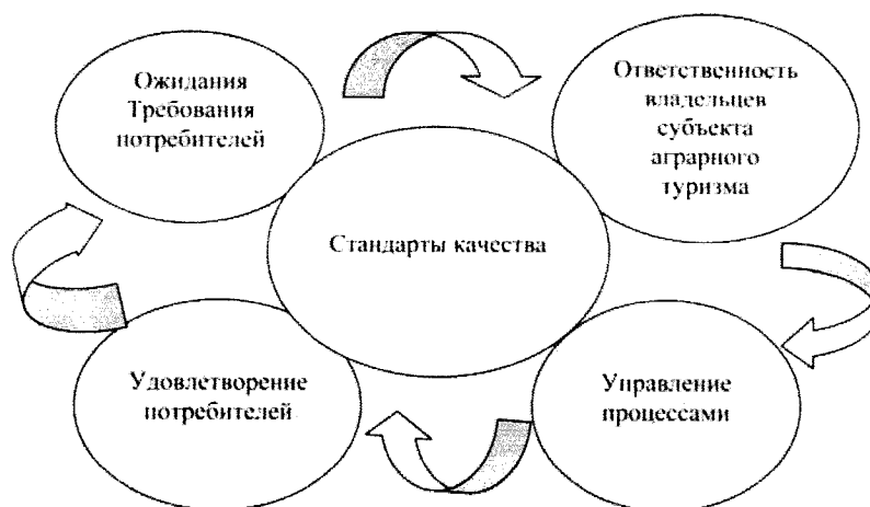
Рис. 6. Модель управления качеством услуг сельского туризма

весь персонал в предоставлении качественной услуги во время личного общения персонала с потребителями. В тех организациях, где присутствует культура, достигается наивысший уровень истинной автономии, создаются условия для поощрения инициативности персонала, желания проявить себя и предлагать нововведения.